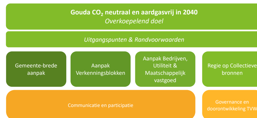
Figuur 3 - Uitvoeringsprogramma TVW Gouda- ter illustratie.

Het isolatieprogramma is vertaald naar een meer uniforme aanpak met de start van de Energie Karavaan Gouda. Dat wordt alom gezien als een goede stap en een mooi resultaat (die zich wel nog moet bewijzen). Bij het verder uitdenken/doorontwikkelen van een uniforme aanpak hebben verschillende bewonersinitiatieven aangegeven hierbij betrokken te willen zijn. Want ook in andere initiatieven is geleerd en zijn stappen gezet. We kunnen elkaar helpen en lessen combineren om samen tot een nog betere aanpak te komen.