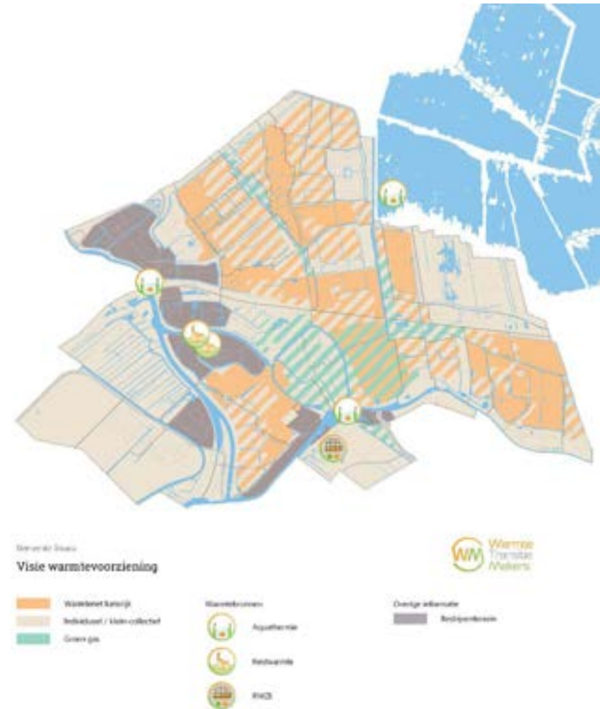
Figuur 2 - Visie warmtevoorziening (kopie uit de TVW vastgesteld in 2021, pagina 36)

De regierol verder invullen en scherper maken, wordt gezien als een belangrijke sleutel tot succes. Een concretere aanpak met een slimme en effectieve samenwerking leidt tot versnelling. Dus, hoewel alle ogen zijn gericht op de gemeente, ligt de sleutel tot succes zeker niet alleen bij de gemeente, maar ook bij de bereidheid om samen te werken en samen besluiten te nemen. Dit vraagt om een andere houding en manier van samenwerking vanuit alle partijen. Hier gaan we in de volgende paragrafen dieper op in.